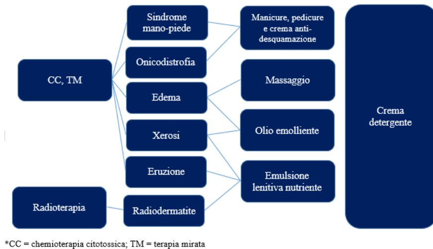
Fig. 1 Terapie oncologiche, effetti dermatologici secondari, benessere corrispondente e trattamenti cosmetici (*)

Il protocollo cosmetico-estetico determina un miglioramento della qualità di vita della persona in terapia (SRQoL).